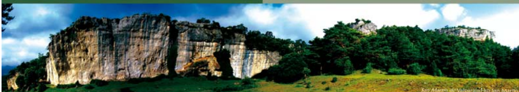
San Martín de Valparaíso-Eko San Martín

Diseinu eta koordinazioa / Diseño y coordinación: Orbea. Dokumentazioa / Documentación: Beatriz Herrera, M o José Sagardoy. Ilustrazioak / Ilustraciones: Ángel Domínguez.