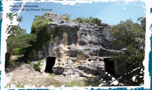
Maiturak haitzuloak Cuevas de los Moros (Corro)

El fenómeno de la construcción de las cuevas artificiales se remonta a hace más del millar de años y es muy frecuente en el norte peninsular, en la cuenca del Ebro. Al parecer, su origen se asocia a la llegada a esta zona de los eremitas, cristianos que vivían en soledad. Eran monjes o religiosos que se entregaban a la vida contemplativa y penitente para buscar a Dios con total libertad. Estos cristianos se alejaban de la sociedad para vivir en lugares recónditos donde construir sus moradas en cuevas artificiales, aprovechando abrigos rocosos. En Alava, las cuevas artificiales abundan en Villanueva de Valdegovía, en la Montaña Alavesa y en el enclave de Treviño.