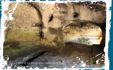
Cueva de los Moros II-ko haitzuloa (Corro)

Los eremitas elegían emplazamientos donde abundaran las rocas blandas, fáciles de trabajar con rudimentarias herramientas como las azuelas. Las cuevas artificiales eran su hogar, su lugar de culto y el emplazamiento para enterrar a los muertos. Los huecos para abrir ventanas y puertas, las repisas, las hornacinas, incluso las tumbas eran excavadas en la roca.